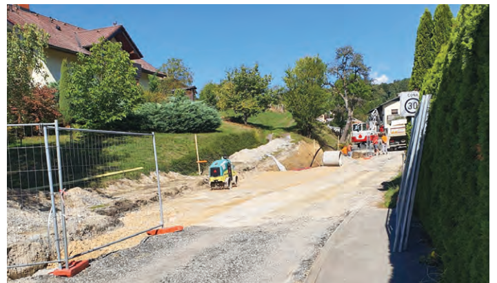
Začela se je prva faza rekonstrukcije ceste skozi naselje Rafolče.