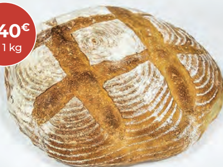
Beli kmečki kruh