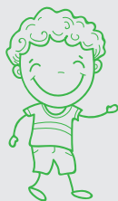
Strokovne delavke vrtca Medo