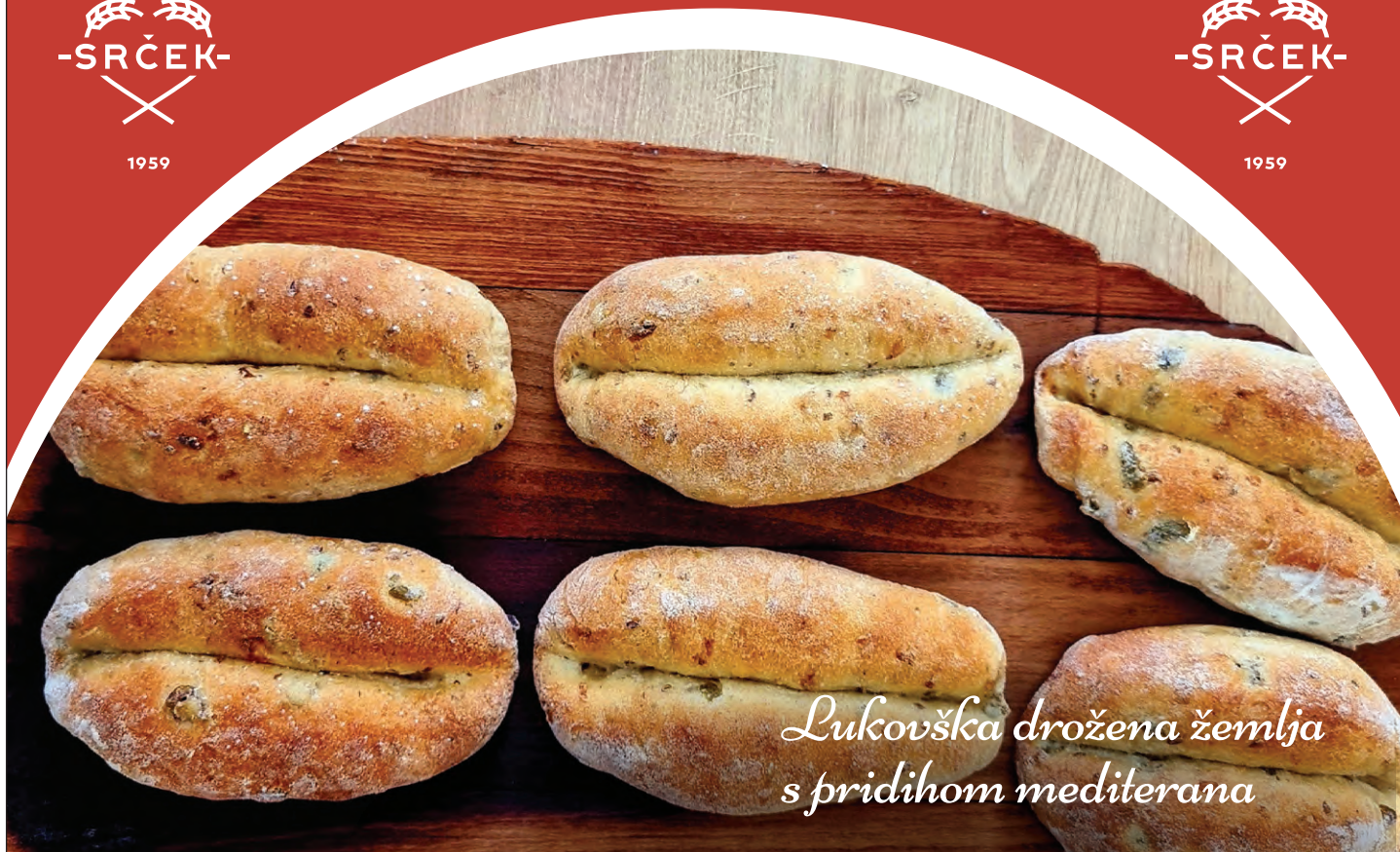
Lukovška drožena žemlja s pridihom mediterana