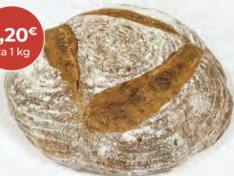
Lukovski črni kruh