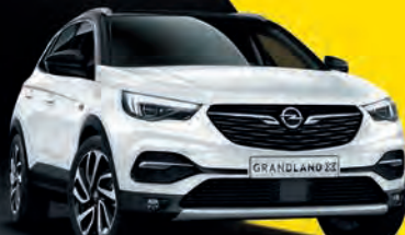
GRANDLAND X že za 20.150 €