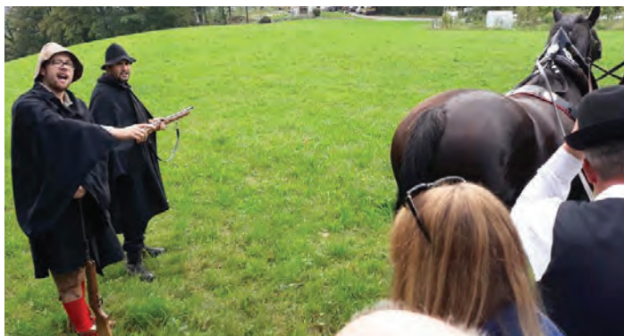
Novinarjem, ki so se zbrali na novinarski konferenci, so pot prekržali rokovnjači.