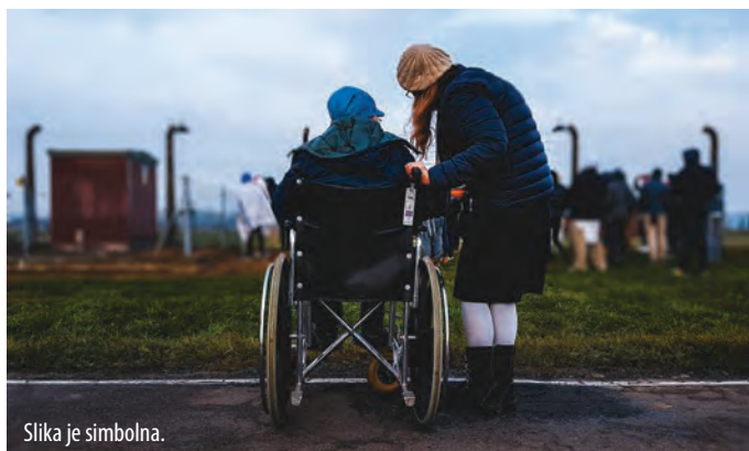
Slika je simbolna.

Področje varstva odraslih v okviru Centra za socialno delo Domžale (v nadaljevanju CSD) vključuje različne ukrepe in storitve posameznikom, skupinam odraslih in starejših uporabnikov, ki so se znašli v stiski in potrebujejo pomoč, bodisi zaradi osebnih težav, starosti, bolezni ali invalidnosti, ker nimajo sredstev za preživljanje, zaradi slabih medosebnih odnosov, ker so žrtve nasilja, ker jim neformalna mreža ne nudi toliko pomoči, kot jo potrebujejo, zaradi odvisnosti od alkohola, drog in drugih substanc in dejavnosti, ker živijo kot brezdomci, bodisi zaradi številnih situacij, v katerih se težje znajdejo.