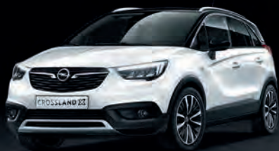
CROSSLAND X že za 14.350 €

Vabljeni na testno vožnjo z urbanimi zapeljivci.