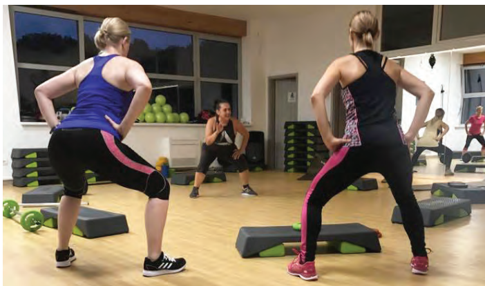
Utrip z brezplačne petkove FIT BOOM vadbe v Lukovici

Drugi septembrski vikend, od 7. do 9. septembra 2018, se je v Srcu Slovenije veliko dogajalo. Skoraj 50 turističnih ponudnikov iz občin Kamnik, Litija, Lukovica, Moravče in Šmartno pri Litiji je pripravilo posebno ponudbo za obiskovalce, tokrat s poudarkom za otroke in družine. Obiskovalci so spoznavali območje Srca Slovenije, domače in sosednje kraje, navezali stike s prijaznimi domačini ter bili deležni aktivnih in raznolikih doživetij.