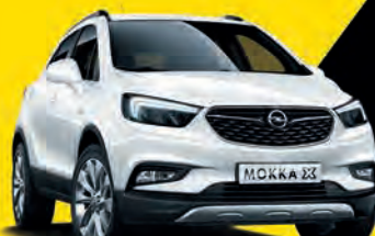
MOKKA X že za 14.700 €