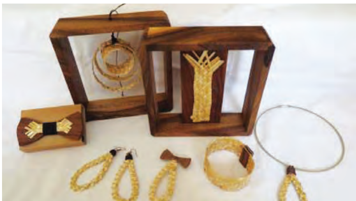
KUD Fran Maselj Podlimbarski – od slamnate kite do sodobnih rokodelskih izdelkov

V samostanu Mekinje v Srcu Slovenije je bila v septembru na ogled razstava rokodelskih izdelkov Srca Slovenije Zgodbe rok in krajev, na kateri so razstavljali izdelke iz slamnatih kit tudi člani KUD Fran Maselj Podlimbarski.